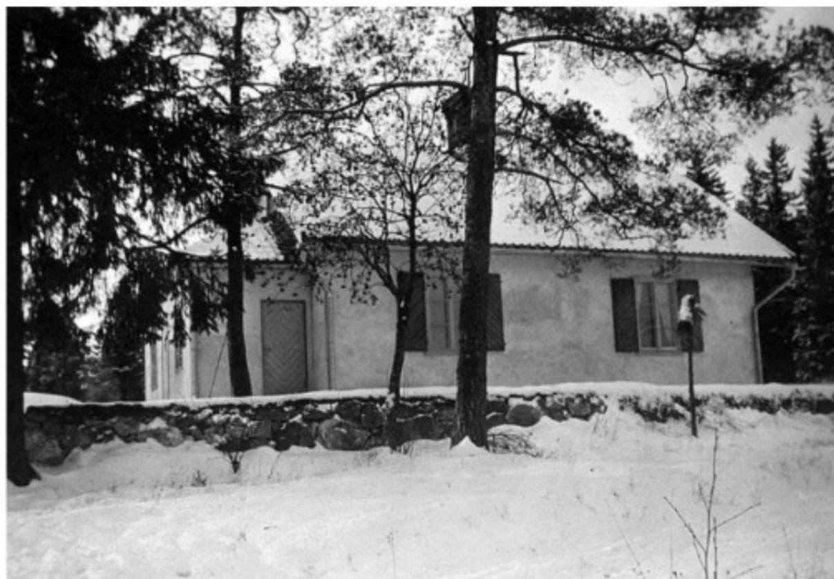
Huset från öster. Det lokalhistoriska arkivet byggs i två plan i slutningen snett till vänster framför huset. Arkivets nedre plan blir under marknivån.