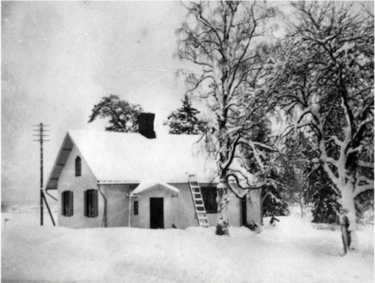
Den s.k. chaufförstugan på Gillobacka restaureras till Kyrksläotts hembygdsförenings samlingslokal. Huset fotograferat från väster på 1930-talet. Till vänster syns Gamla kustvägen mot Jorvas.

“I museer sammanbringas typer på klädebonader, möbler, redskap och husgeråd från olika tider, från skilda trakter, från olika stånd. Vi har mer än andra orsak att härutinnan följa exemplet från utlandet, ty vår kultur är i grund och mycket smaklös. Vi följa stundens nycker då vi bygga oss en kyrka eller ett boninghus såväl som då vi köpa oss nya kläder. [...] I dessa samlingar av olika slag kommer folkets eller landets rätta karaktär till synes. Besökaren av ett museum eller en naturpark får med sin fantasi dikta sig in i sitt folks och sin stams underbara förflutna och se framför sig ett stycke av landet sådant det skulle te sig, om ingen människohand, stundom vägledande, men stundom också obarmhärtigt skövlande, komme den vid.”